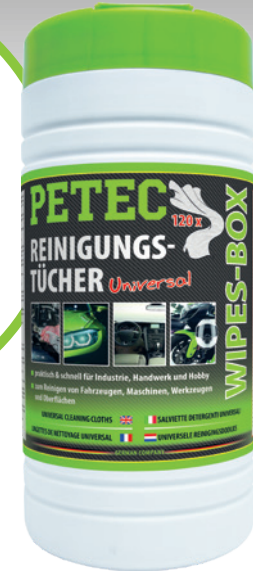
Reinigungstücher Wipes-Box 120 Tücher-Box Art.-Nr. 82120