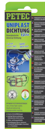
» dauerplastische Universaldichtmasse «