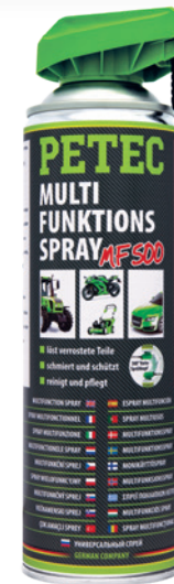
Schmierem Pflegen MF500 Multifunktionspray 500 ml Spray Art.-Nr. 71250