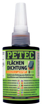
orange, mittelfest, 75 ml Art.-Nr. 97175