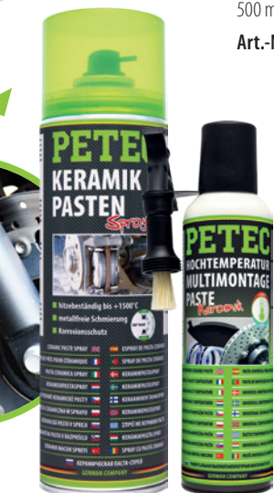
» metallfrei auf Keramikbasis «