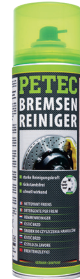
Bremsenreiniger Spray 500 ml Spray Art.-Nr. 70060