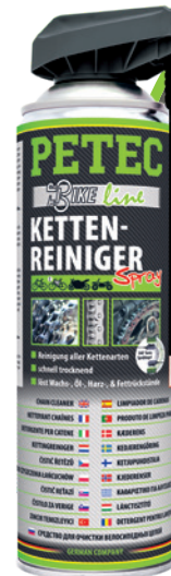
Kettenreiniger Spray 500 ml Spray Art.-Nr. 70540