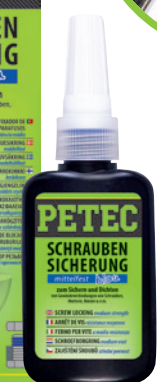
Sichern universell Schraubensicherung mittelfest 5 g Flasche Art.-Nr. 91005