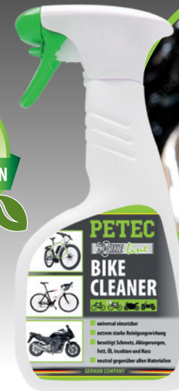
Bike Cleaner 500 ml Sprühflasche Art.-Nr. 60150