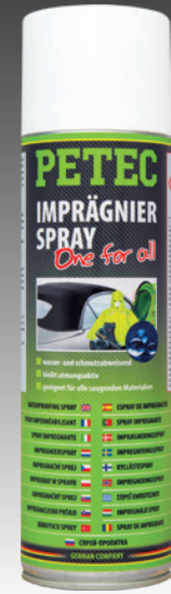
Imprägnierspray „One for all“ 500 ml Spray Art.-Nr. 72750