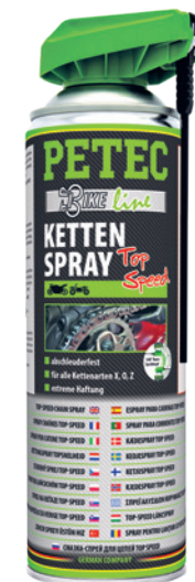
Kettenspray Top-Speed 500 ml Spray Art.-Nr. 70550

Telefon: +49 95 55-80 99 419 eMail: technik@petec.de