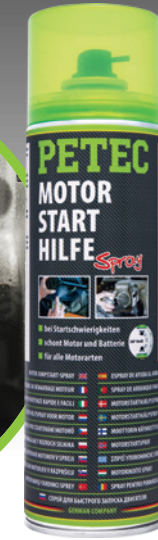
Motorstarthilfe 500 ml Spray Art.-Nr. 70450