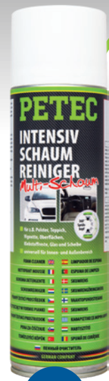
Intensiv Schaumreiniger Spray 500 ml Spray Art.-Nr. 72850