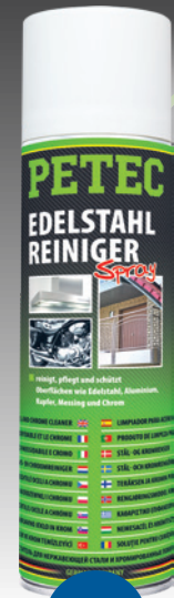
Edelstahlreiniger Spray 500 ml Spray Art.-Nr. 70260