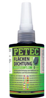
Flächendichtung, aushärtend grün, niedrigfest, 75 ml Art.-Nr. 97075