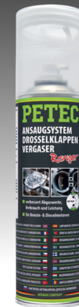
Ansaugsystem-, Drosselklappen- & Vergaserreiniger 500 ml Spray Art.-Nr. 72450